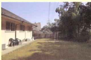
多目的利用の中庭