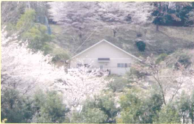
陽だまりの家町田の全景

当ホームは、利用者様の終の棲家となる様ターミナルケアを視野に入れ運営に取り組んでいます。 (ターミナル期の身体的状況を主治医と相談の上、可能な限り利用者ご家族の希望に沿う様なケア体制を取っています。)