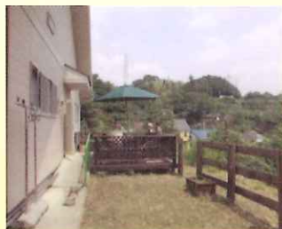
見晴らしのいいテラス